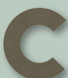
665 DARK OLIVE CANVAS