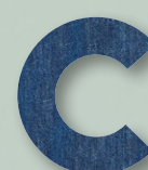
830 NAVY DENIM