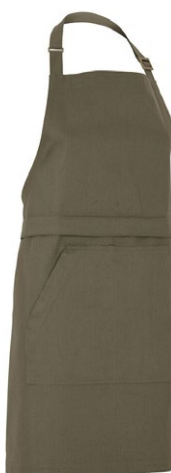
665 Dark Olive

Matière: 100% coton écologique Fairtrade Poids: Twill 210 g/m 2 (665, 990), Denim 10,5 oz (840)