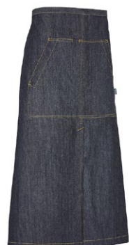
840 Dark Blue