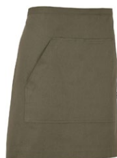
665 Dark Olive

Matière: 100% coton écologique Fairtrade Poids: Twill 210 g/m 2 (665, 990), Denim 10,5 oz (840)