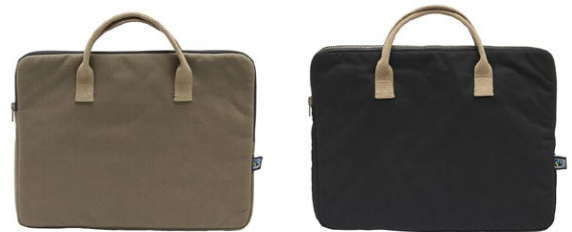
665 Dk Olive

Dimensions: 50 cm, ø 26 cm, 25 l Matière: 100% coton écologique Fairtrade Poids: 310 g/m 2