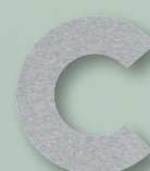
960 GREY MELANGE