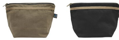
665 Dk Olive

Dimensions: 28x12x38 cm, 13 l Matière: 100% coton écologique Fairtrade Poids: 310 g/m 2