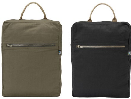
665 Dark Olive

Nous avons toujours besoin d'emporter des affaires avec nous. Au travail, à l'école, la brosse à dents, l'ordinateur, les courses. Des indispensables ou simplement des choses utiles. Cottover propose une petite collection des porte-objets les plus essentiels, simples et abordables, parfaits pour des impressions de grande taille. Et même sans marque, l'étiquette Fairtrade envoie son propre message clair.