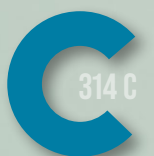
744 DARK TURQUOISE