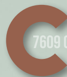
462 RUST RED