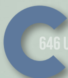
748 DUSTY BLUE