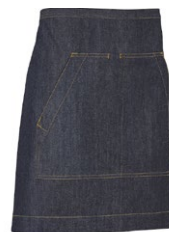
840 Dark Blue