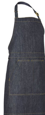
840 Dark Blue