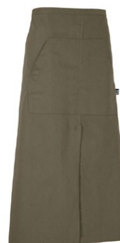
665 Dark Olive

Matière: 100% coton écologique Fairtrade Poids: Twill 210 g/m 2 (665, 990), Denim 10,5 oz (840)