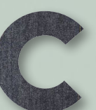
840 DARK BLUE DENIM