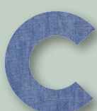
820 BLUE DENIM