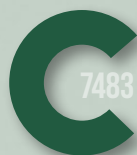
648 DARK GREEN