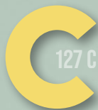
230 LIGHT YELLOW