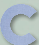
716 LIGHT BLUE OXFORD