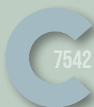
730 MISTY BLUE