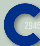
767 ROYAL BLUE